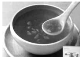
18.北海道トマトスープ