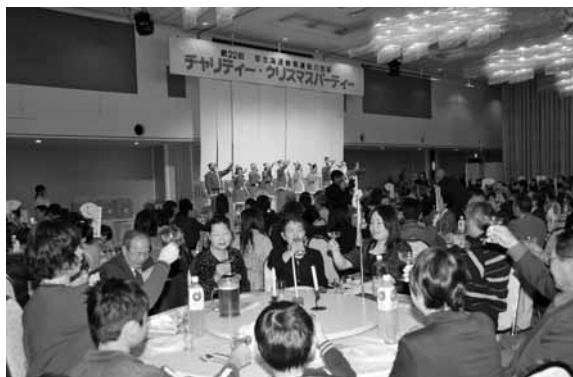
メリークリスマス 乾杯！