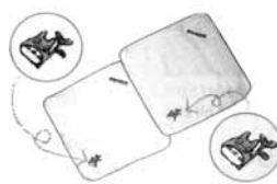
22.トロポーフンド ミニタオルセット