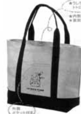
23.トロポーフンド トートバック(大) (グレイ×紺)