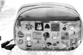
20.トロポーチM <森のめぐみ>