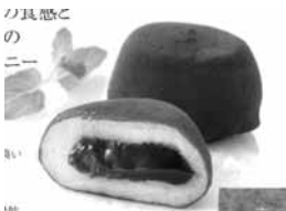
6.生チョコ雪もち (エクセレントビター)