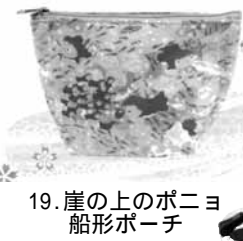
19.崖の上のポニョ 船形ポーチ