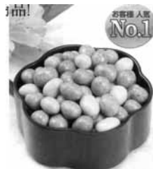
14.お徳用あとひき豆