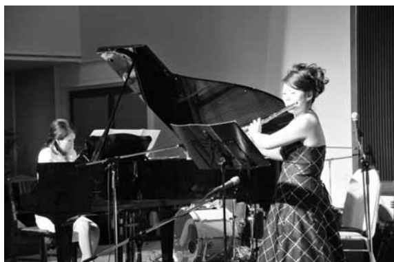
オープニング演奏

又、今年も学生ボランティアのみなぎる若い力にささえられ、準備から本番へと順調に作業を進める事が出来ました。旭川厚生看護専門学校、旭川福祉専門学校、北都保健福祉専門学校、旭川大学保健福祉学部、旭川大学女子短期大学の学生ボランティアの皆様