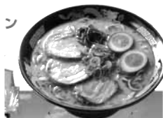
3.熊本もっこす亭 とんこつラーメン