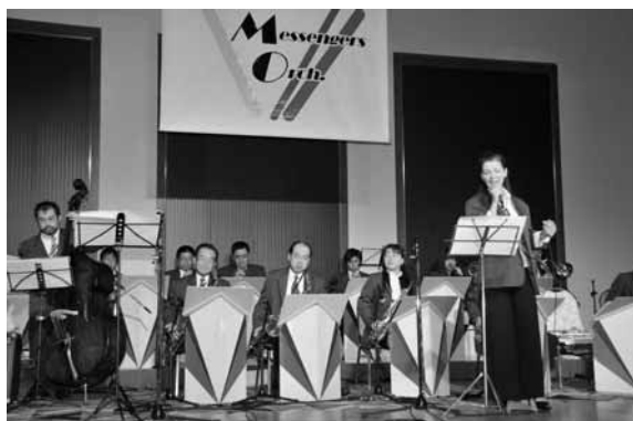
スウィングメッセンジャーズオーケストラ