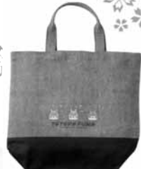
21.トロポーフンド 3匹のトロトートバック (濃緑×緑・ツートン)