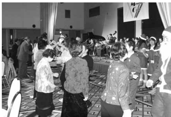
サンタと一緒にダンス・ダンス

しこの夜」の大合唱をリードして閉幕と成りました。305名のお客様と75名の学生ボランティアが参加した旭川支部最大のイベントは無事に終了しました。年々厳しくなる中、多くの方々から寄せられるご協賛は本当に最高のクリスマスプレゼントです。これからも実行委員及びボランティアのみなさんと参加者の皆様に楽しんでもらえる「クリスマスパーティー」をしたいと思っておりますのでどうぞご期待下さい。あらためて多くの皆様のご協力に心より感謝申し上げます。（事務局）