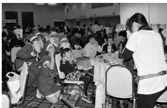
サンタと一緒に記念写真