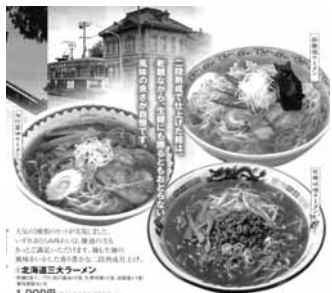
1.北海道三大ラーメン