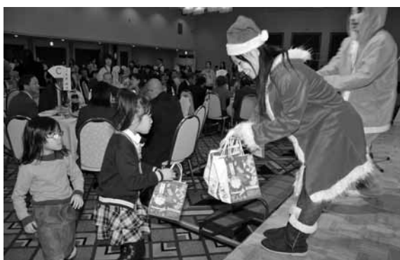
子供たちへサンタさんからプレゼント