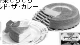
10.北海道酪農 チーズケーキ