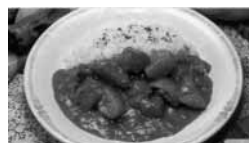
4.野菜ごろごろ マイルド・ザ・カレー