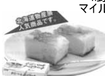
9.カマンベール チーズケーキ