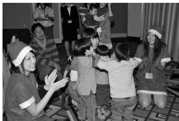
子供コーナーは、毎年ちびっ子たちにとっても人気