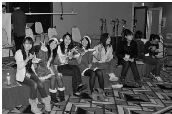
次の準備の間ちょっと休憩中の学生ボランティアさん