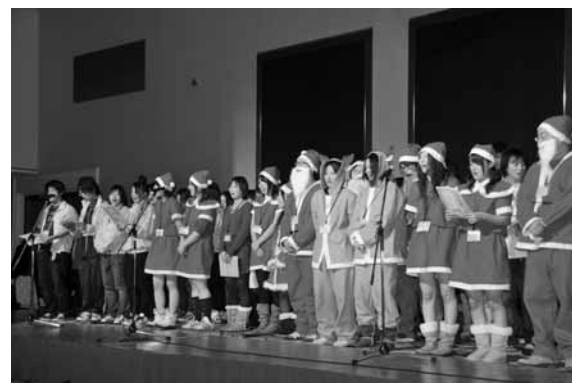
合唱「きよしこの夜」をリードする学生ボランティアさん