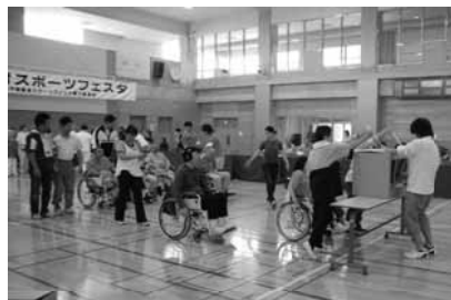
パン屋さんへ行こう(パン取り競争)