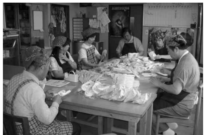
「きらら」利用者の作業風景