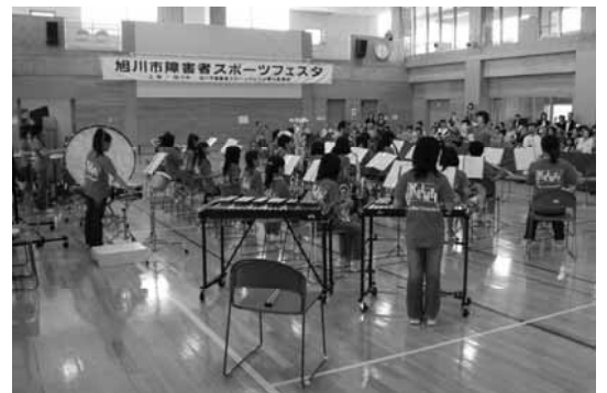
啓明小学校吹奏楽クラブ