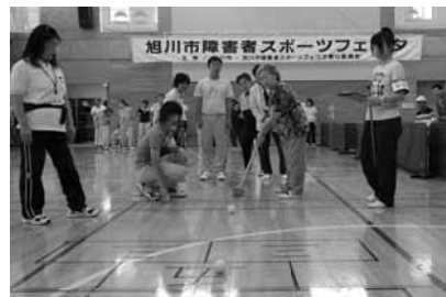
み・こ・と ストライク