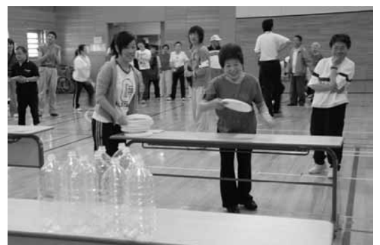
新種目の「ペットボトルクラッシュ」